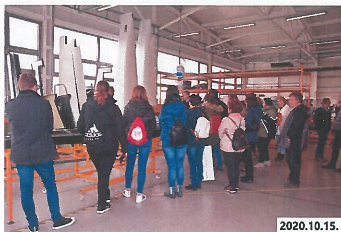
Genevation Aircraft Kft. – Jakabszállás – 2020.10.15.