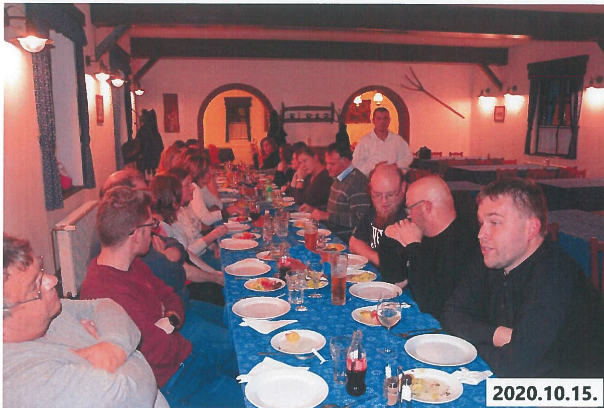
Vacsora a Karikás Csárdában – Nagybugacpuszta – 2020.10.15.

A látványos közel fél órás bemutatót követően egy ízletes vacsora elfogyasztásával zárult a tanulmányút programja, melyet követően Hajósra indultak a résztvevők.