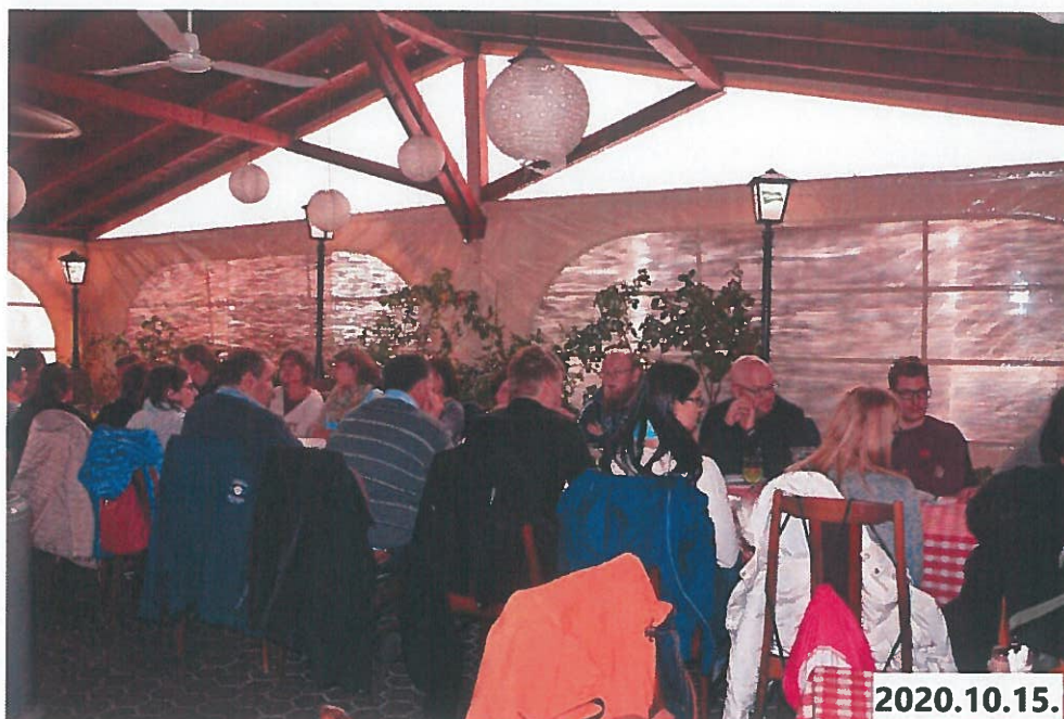
Ebéd a Desperado Étteremben – Kiskunfélegyháza – 2020.10.15.

A gyárlátogatást követően Kiskunfélegyházán folytatódott a program egy ebéddel a Desperado Étteremben.