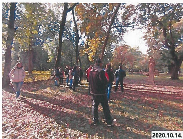
Nagy Fakopáncs Tanösvény, Kossuth Park – Bácsalmás – 2020.10.14.