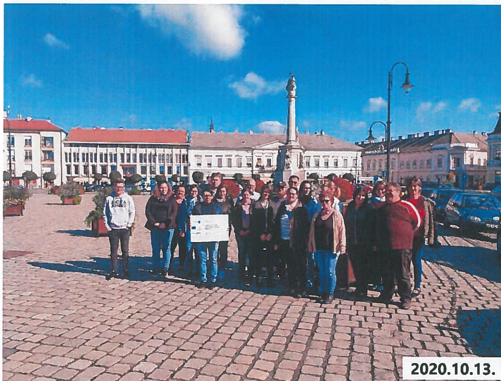
Városnézés, majd szabad program – Baja – 2020.10.13.