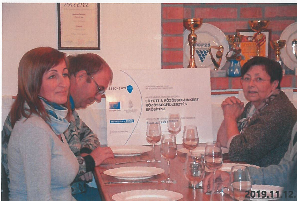
Vacsora és borkóstoló az Agancsos Pincészetben – Villány – 2019.11.12.