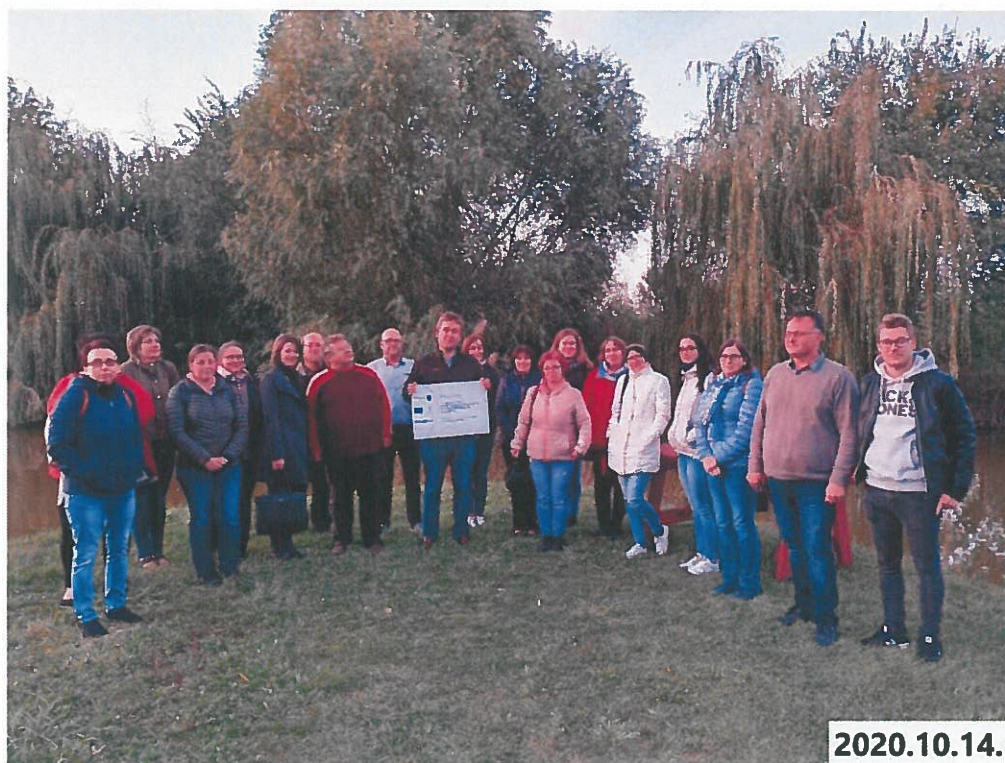
Csoportkép a Tóbisztró Étterem melletti tónál – Bácsalmás – 2020.10.14.

Az interaktív és kötetlen beszélgetéssé avanszált programelemet követően újfent a helyi Tóbisztró Étteremben költötték el a vacsorájukat a résztvevők, ezt követően pedig visszautaztak Bajára a szállásukra.