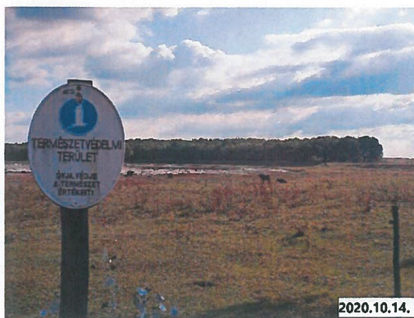
Sóstó – Bácsalmás – 2020.10.14.