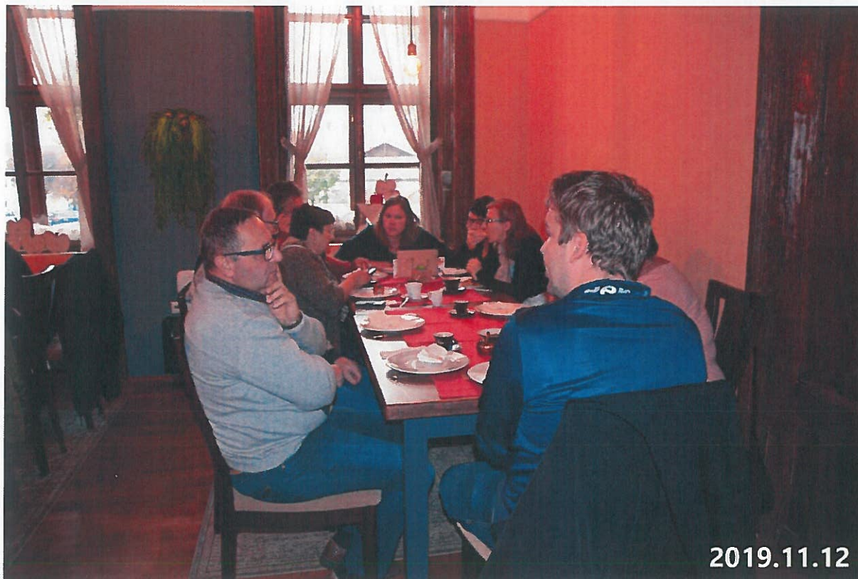
Reggeli Bólyban a Kiskastély Vendéglőben – 2019.11.12.

A Bólyba történő megérkezést követően egy rövid reggeli következett a bólyi Kiskastély Vendéglőben, majd ezt követően Villányba utaztak a résztvevők.