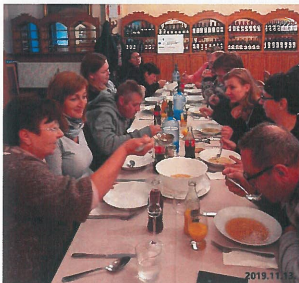
Ebéd a Hétfogás Fogadóban – Villány – 2019.11.13.

A tanulmányút második napján a reggelit követően egy szabad program következett Villányban, majd egy ebéddel zárult a programelem villányi része.