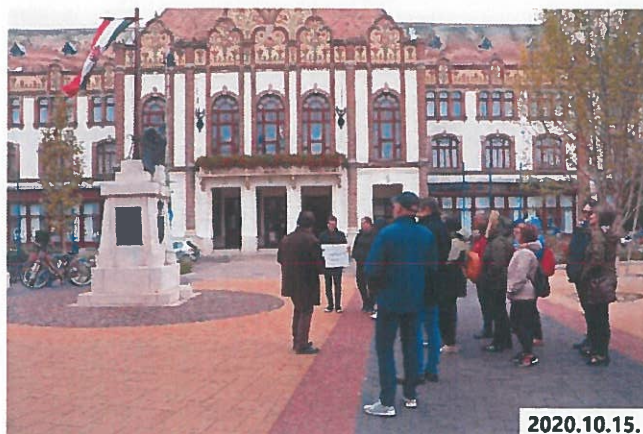
Városnézés idegenvezetéssel – Kiskunfélegyháza – 2020.10.15.

A városnézés végeztével a fenti, jobb oldali képen látható Városházán folytatódott az utolsó nap programja.