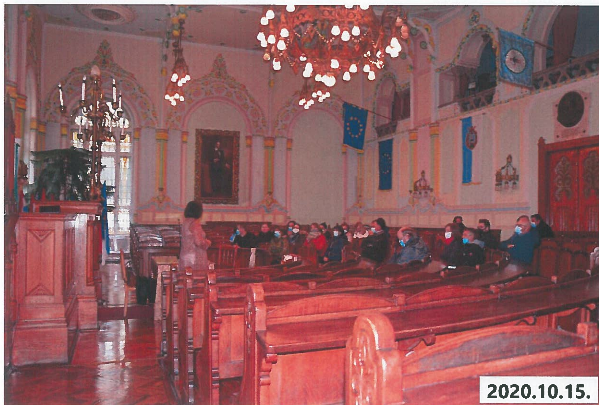
Városháza díszterme- Kiskunfélegyháza – 2020.10.15.

A városnézés végeztével a fenti, jobb oldali képen látható Városházán folytatódott az utolsó nap programja.