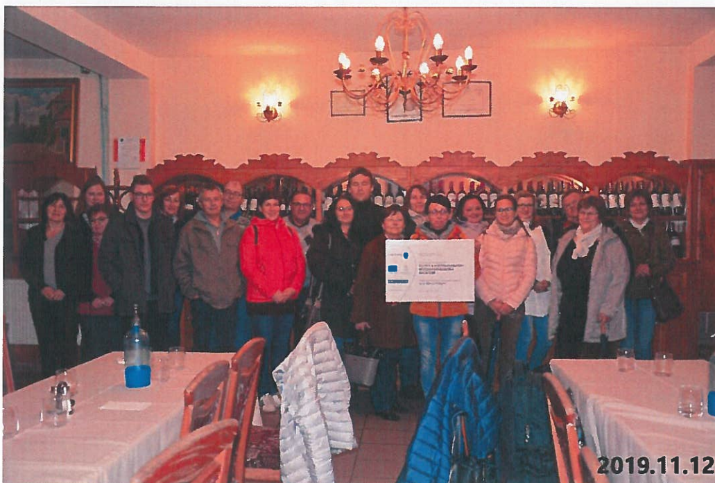
Csoportkép Villányban – 2019.11.12.

A Belföldi tanulmányút programelem 2019.11.12-től, 2019.11.13-ig került megrendezésre, Villány és Bóly településeken. A tanulmányúton 20 fő hajósi lakos vett részt. 16 fő képviselte Hajós Város Önkormányzatát, 2 fő Hajós Város Önkéntes Tűzoltó Egyesületét, 1 fő a Hajósi Hagyományörző Sváb Néptánc Egyesületet, valamint 1 fő a Hajósi Német Nemzetiségi Önkormányzatot. Jelen volt Hajós város polgármestere, jegyzője, valamint egy önkormányzati képviselő is. A programelem a szakmai vezető és a szolgáltatást szervező és lebonyolító személy vezetésével zajlott.