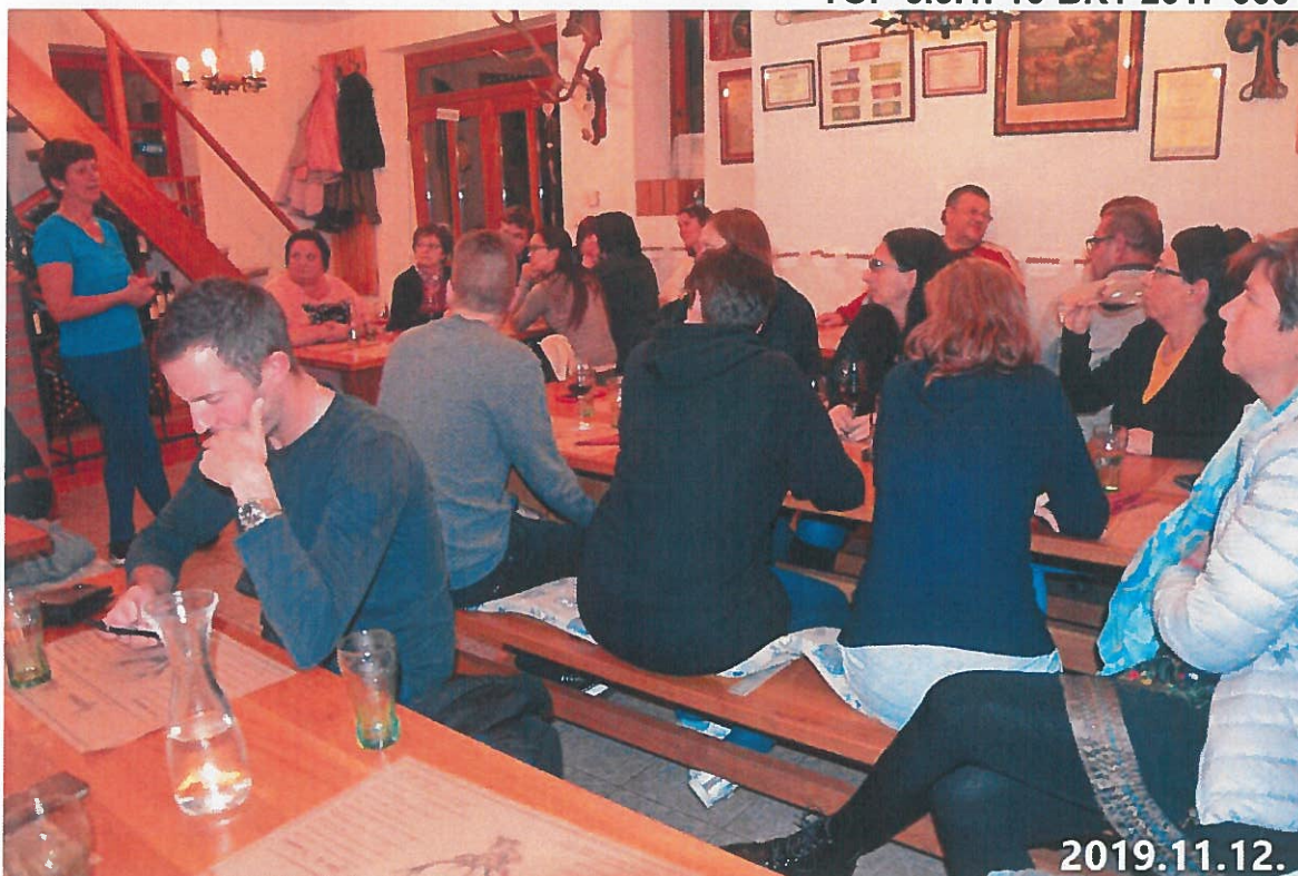
Vacsora és borkóstoló az Agancsos Pincészetben – Villány – 2019.11.12.