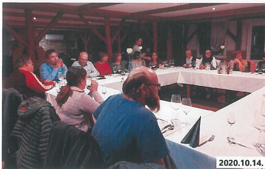
Vacsora a Tóbisztró Étteremben – Bácsalmás – 2020.10.14.