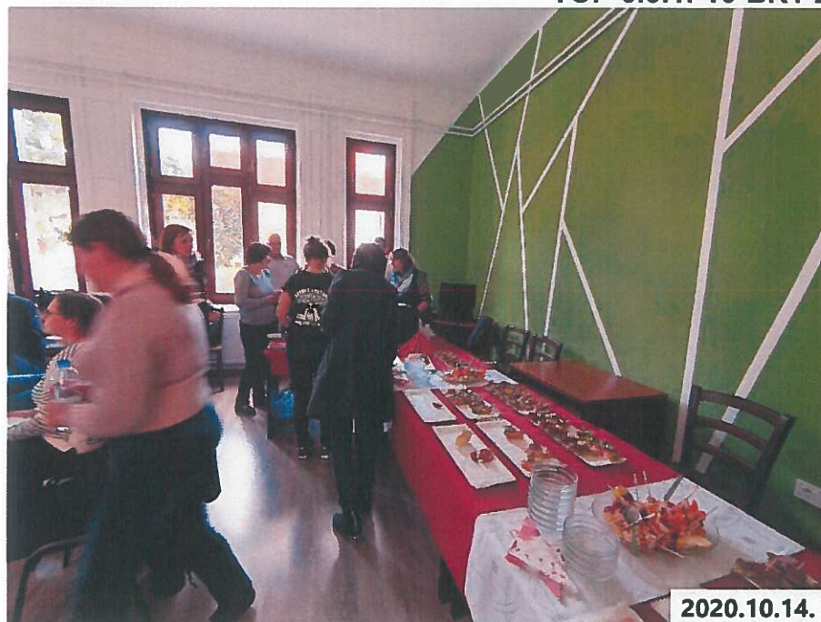
Ebéd a Fészek Házban – Bácsalmás – 2020.10.14.

A Kékfestő Műhelyben tett látogatás után egy rövid sétát követően a Fészek Házban került sor egy bőséges szendvics ebédre. Ezután buszra szálltak a résztvevők, az úti cél pedig a település mellett található, a Bácsalmási Védett Erdő és Gyepék Természetvédelmi Területen található Sóstó volt. A szikes tó mellett egy bivalylessel egybekötött rövid túrán kaptak betekintést a hajósiak a természetvédelmi terület látnivalóiról, valamint az elmúlt évek, tavat érintő fejlesztéseiről.