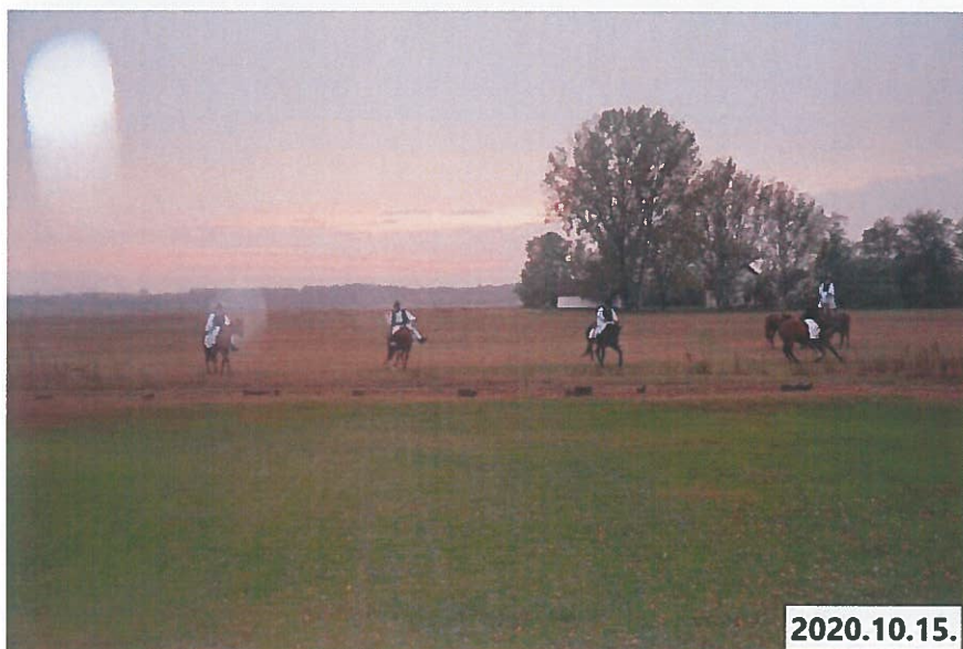
Lovasbemutató – Nagybugacpuszta – 2020.10.15.