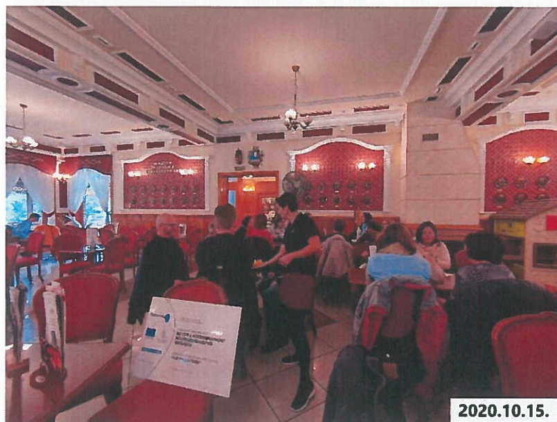
Reggeli a Szent Korona Cukrászdában – Soltvadkert – 2020.10.15.

A tanulmányút harmadik és egyben utolsó napján Soltvadkerten a Szent Korona Cukrászdában fogyasztották el reggelijüket a résztvevők. Ezt követően Jakabszálláson folytatódtak a programok.