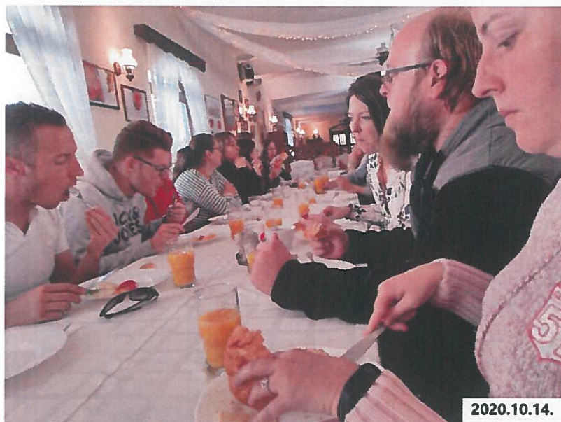
Reggeli a Sobri Étteremben – Baja – 2020.10.14.

A tanulmányút második napján a reggeli elfogyasztása újfent a Sobri Étteremben történt Baján, majd ezután Bácsalmásra utaztak a résztvevők.