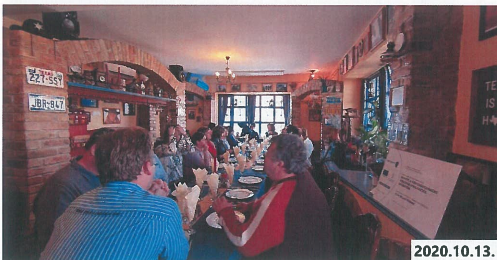
Ebéd a Texas Étteremben – Csávoly – 2020.10.13.

Az előadásokat követően egy ebéd következett Csávolyon a Texas Étteremben.