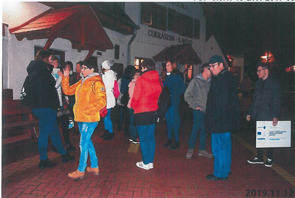
Rövid séta a borkóstoló előtt – Villány – 2019.11.12.