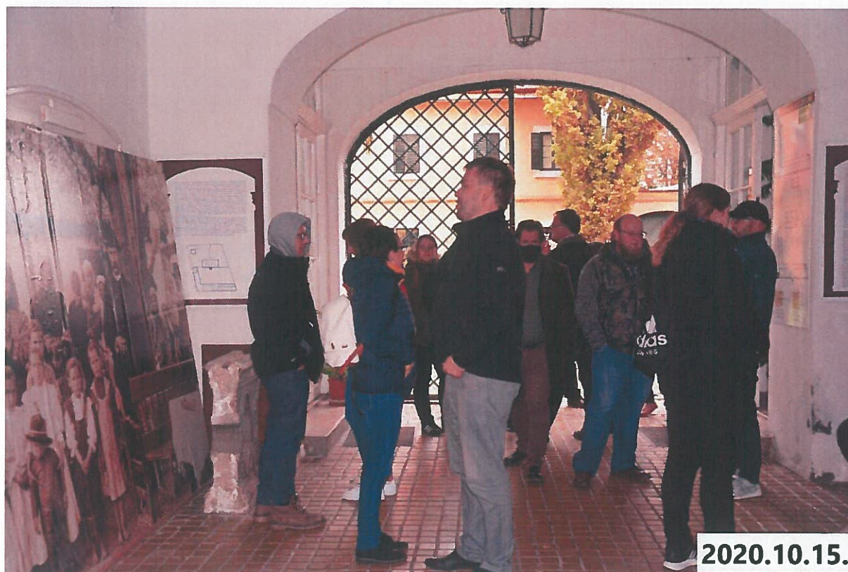
Gyülekező a múzeum bejáratánál – Kiskunfélegyháza – 2020.10.15.