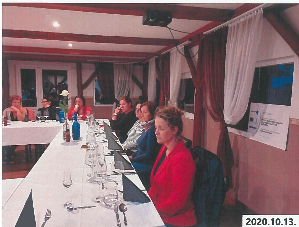
Vacsora a Tóbisztró Étteremben – Bácsalmás – 2020.10.13.