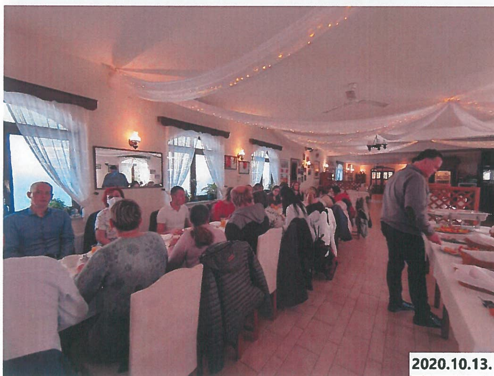
Reggeli a Sobri Étteremben – Baja -2020.10.13.