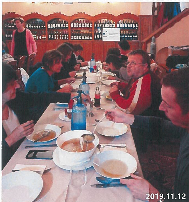
Ebéd Villányban a Hétfogás Fogadóban – 2019.11.12.