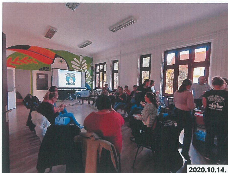
Uzsonna a Fészek Házban – Bácsalmás – 2020.10.14.

A Kossuth Parkban tett látogatás után a nap utolsó programja következett, mégpedig egy szakmai programmal egybekötött uzsonna a Fészek Házban.